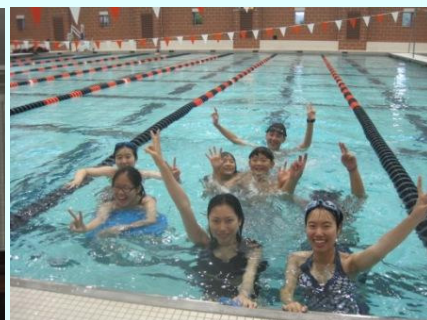
UVA 标准泳池，这里出了 2012 奥运冠军