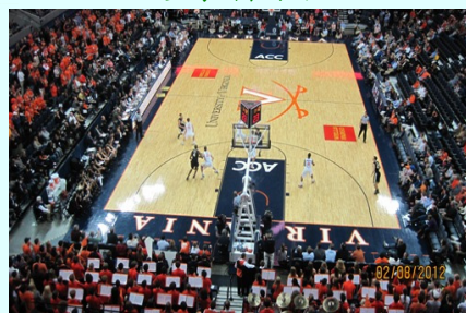
恰逢 NCAA 赛季