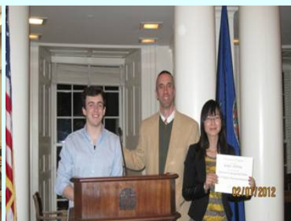
毕业典礼在 UVA 地标 Rotunda 内进行