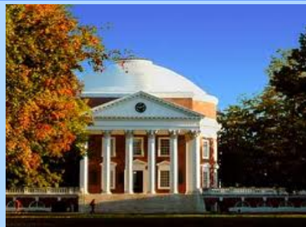
UVA 地标建筑 Rotunda

UVA位于美国东部弗吉尼亚州，该州出过8位总统，享有“总统之乡”的美誉；UVA所在小城更是人杰地灵，是三位国父级总统的故乡，这里风光秀美，掩映在自然生态中的城市纯净得让人心醉。有别于喧嚣的大都市，这里民风古朴醇厚，是真正的美国文化核心区。