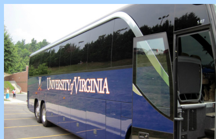
UVA 校车接送（自带 WiFi）