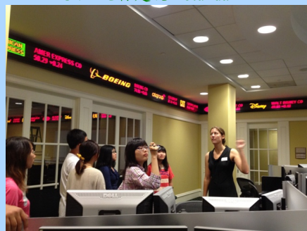
参访 UVA 各专业学院